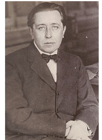
Años y leguas, Gabriel Miró.

[...] Cuando Sigüenza salía de su ciudad al campo, el tránsito de todo su sentir era rápido y puro hasta en su atmósfera interior. La vida rural de entonces, sus soledades, su silencio, su calma, su olor, sus gentes, correspondían al concepto prometido. Alicante era una ciudad de terrados blancos, con palomos que iban y volvían en el azul. Todas sus casas, con sensación de escollera, de faro, de haber sido mar y de tenerlo bajo de la piedra.